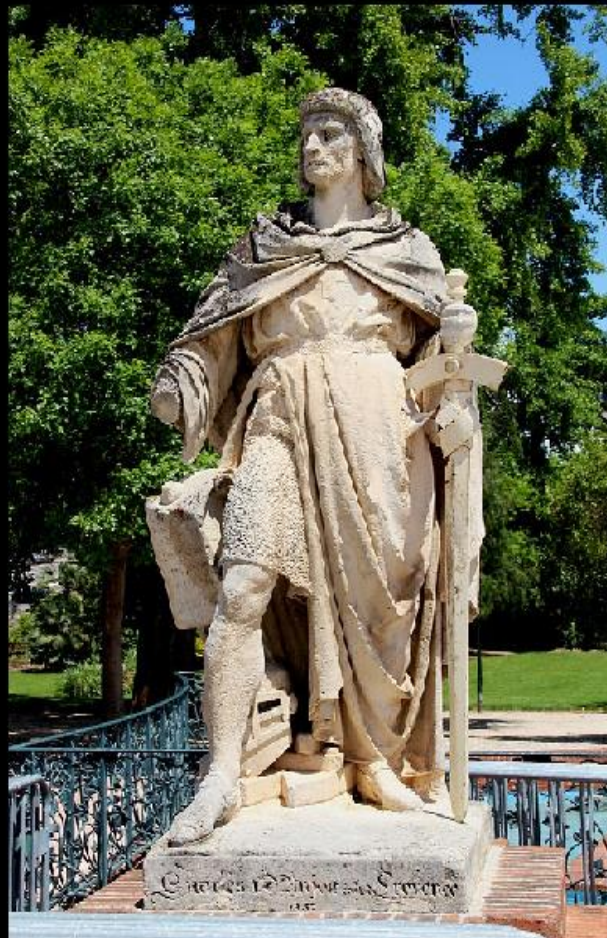
Statue af Karl af Anjou i Hyères i Provence.