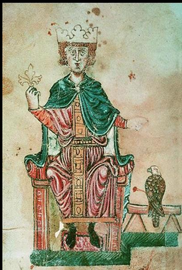
Frederik II i sin bog om falkejagt, Kunsten at jage med fugle.