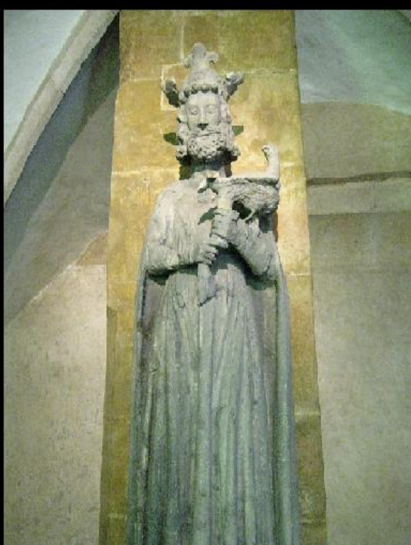
Statue af Frederik 2. i Regensburgs sorte tårn.