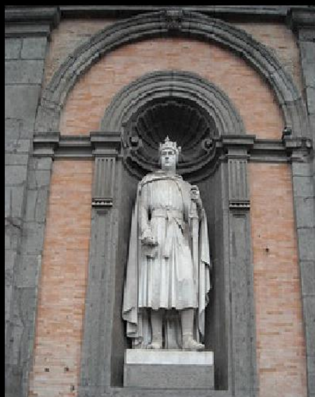
Statue af Karl af Anjou foran Palazzo Reale i Napoli.